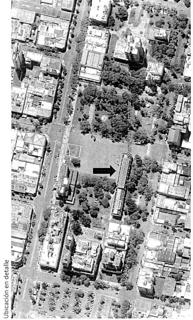
Ubicación en detalle